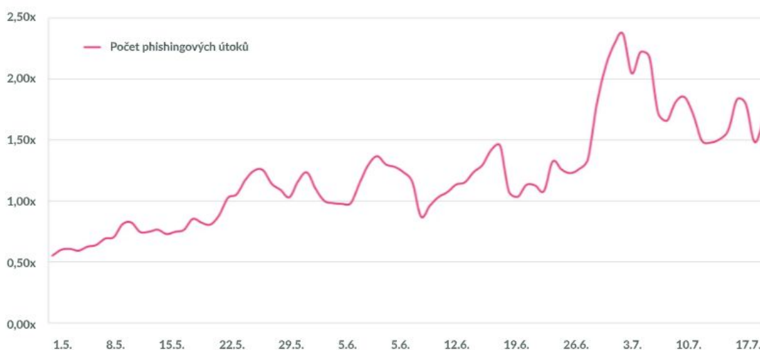
Graf č.1 Počet phishingových útoků

Při phishingovém útoku se obvykle podvodník snaží přimět svou oběť k návštěvě podvržené stránky, tzv. návnady, za účelem získání důvěrných informací (např. hesla). Phishing se primárně zaměřuje na obecně známé značky nebo témata, které mají vysokou šanci, že koncový uživatel klikne na odkaz vedoucí oběť k návnadě. Covid-19 byl tedy v posledních měsících velmi vděčným tématem pro mnoho útočníků. Na grafu č.1 můžeme pozorovat, že pomyslného vrcholu dosáhly phishingové útoky 28. Června. Od tohoto data počet útoků pozvolně klesá, což poukazuje na to, že téma koronaviru již není tak účinné. Útočníci se nyní začnou zaměřovat na jiná, více aktuální témata.